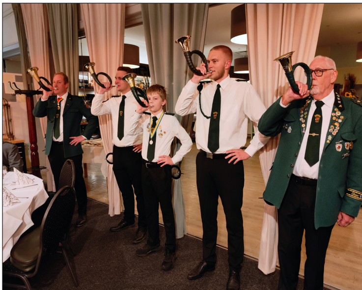
Hubertusfest-Eröffnung durch die Jagdhornbläser