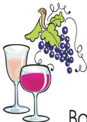
Foto - Wein - Spirituosen

Dekoratив verpackte Geschenkartikel und Gutscheine