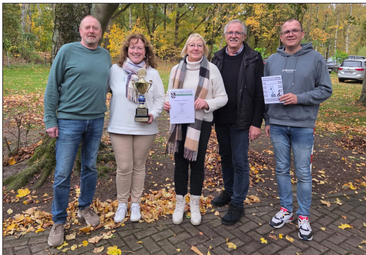
Die Siegermannschaft - Brassband der Bürgerschützen

Trotz sportlicher Rivalität stand wie immer die Freundschaft zwischen den Musikvereinen im Mittelpunkt. Bei bester Stimmung wurde geschossen, gelacht und geplant – unter anderem die Neuauflage des Vergleichsschießens im Oktober 2026.