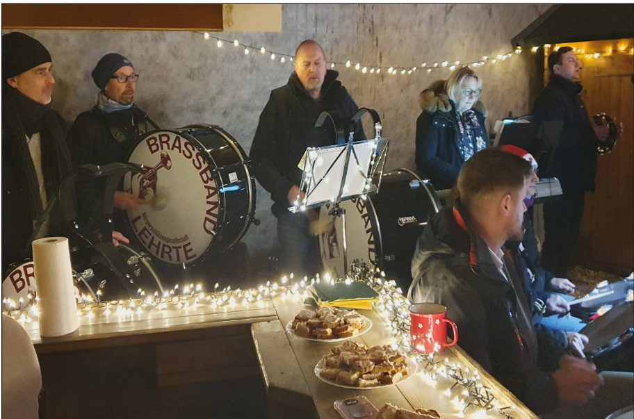
Auf dem Molsen-Hof beim Weihnachtsmarkt

Wir freuen uns schon jetzt auf viele schöne Auftritte und darauf, unser Publikum wieder musikalisch begleiten zu dürfen.